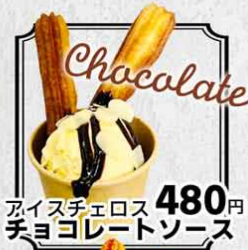
アイスチュロス チョコレートソース 480円