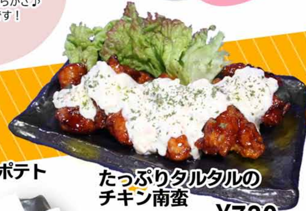
たっぷりタルタルの チキン南蛮 ¥730