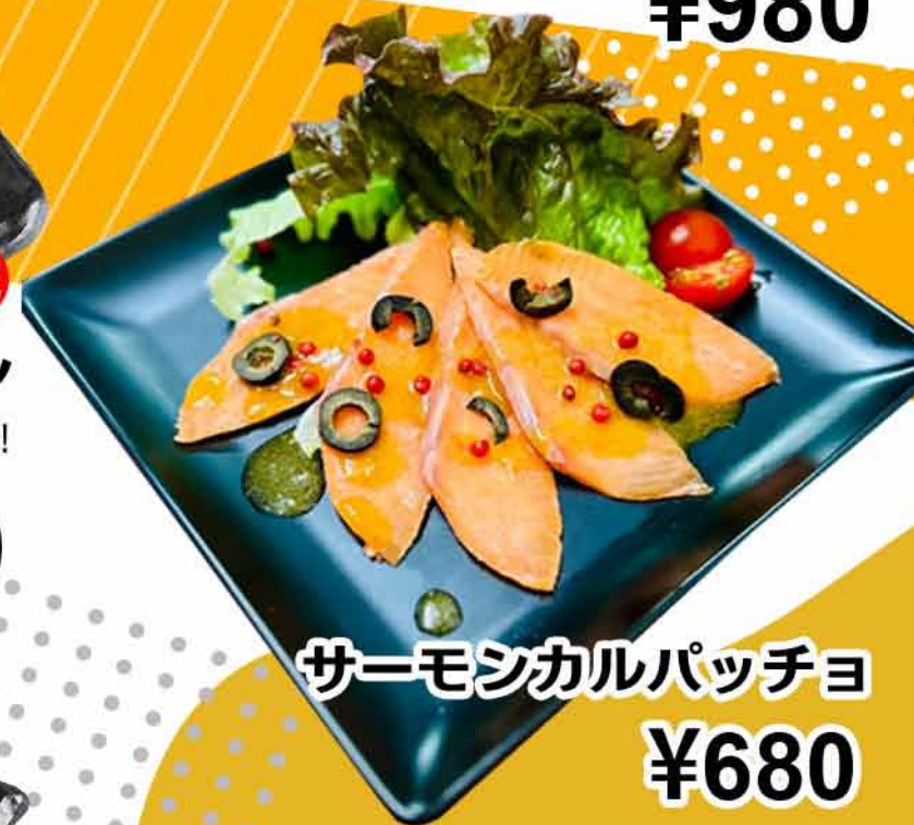
サーモンカルパッチョ ¥680