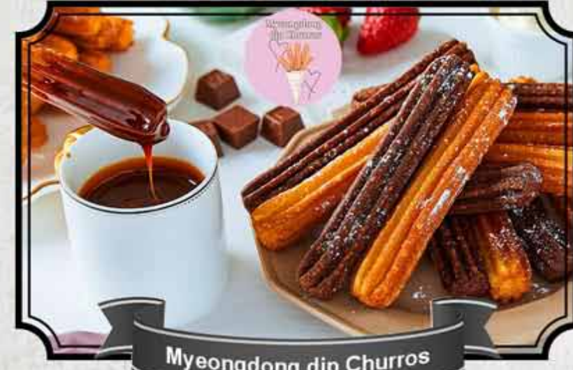
Myeongdong dip Churros

韓国で話題のディップチュロス！日本でもテーマパークや映画館などで大人気！ 一度食べたらやみつきに・・・！まずはそのまま♪甘くてモチサク食感が人気のチュロス！ ディップして更に美味しくお召上がりいただけます♪