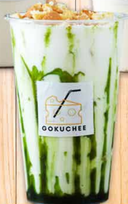
抹茶GOKUCHEE Matcha Gokuchee 700円