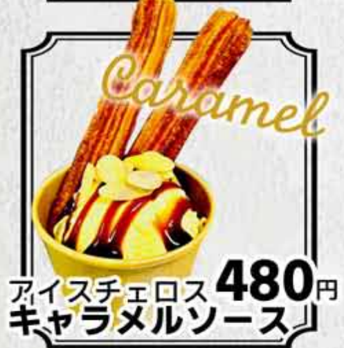
アイスチュロス キャラメルソース 480円