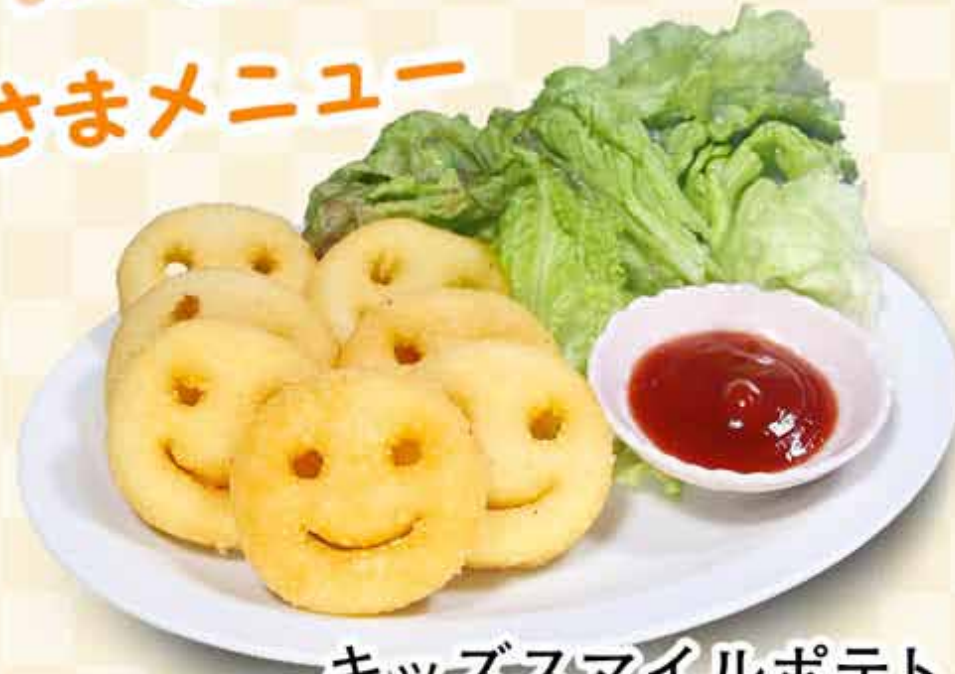
キッズスマイルポテト 390円