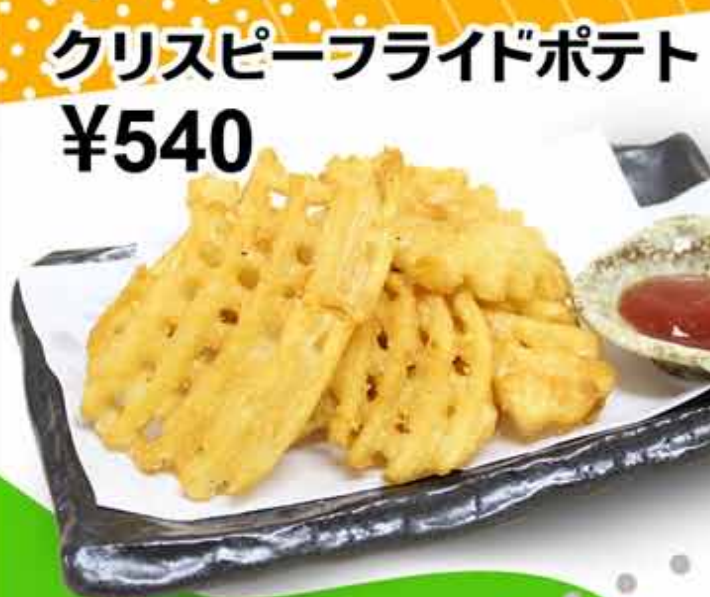
クリスピーフライドポテト ¥540