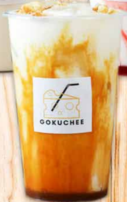
キャラメルGOKUCHEE Caramel Gokuchee 700円