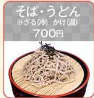
そば・うどん ※ざる(冷) かけ(温) 700円