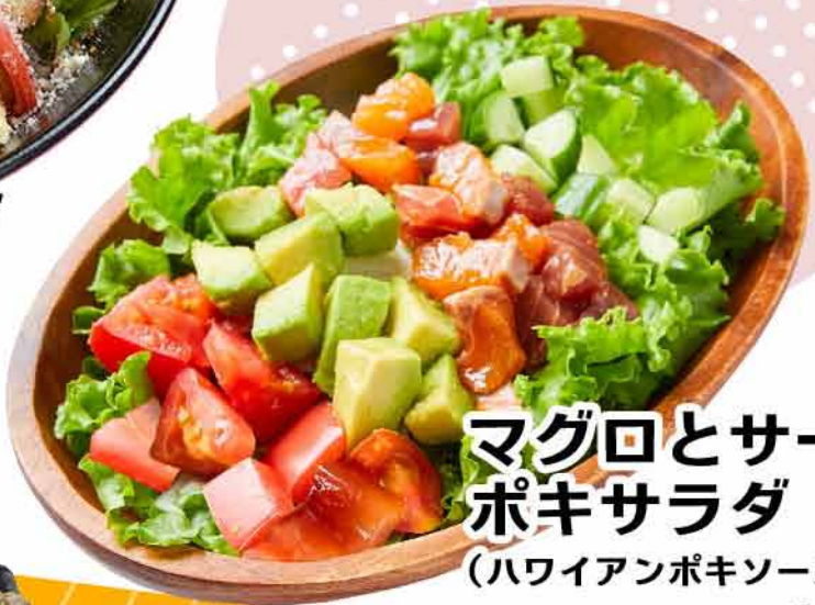
マグロとサーモンの ポキサラダ (ハワイアンポキソース) ¥980