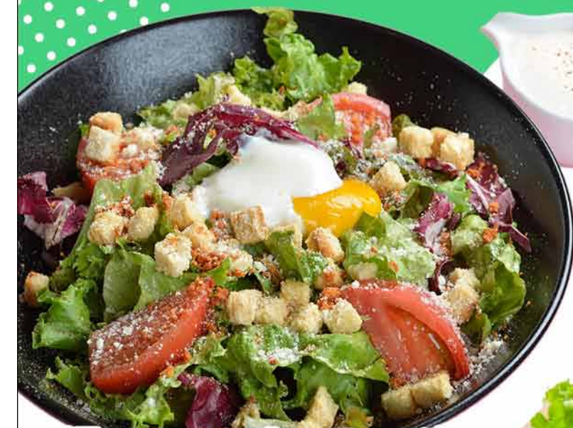
温玉シーザーサラダ (シーザードレッシング)