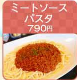
ミートソース パスタ 790円