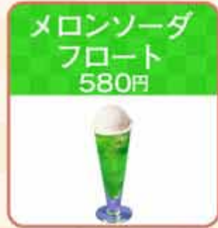
メロンソーダ フロート 580円