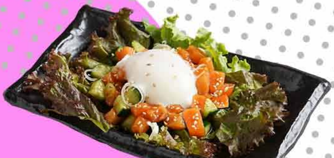
サーモンの韓国風ユッケ ¥750