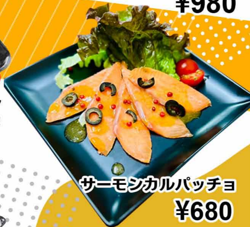
サーモンカルパッチョ ¥680