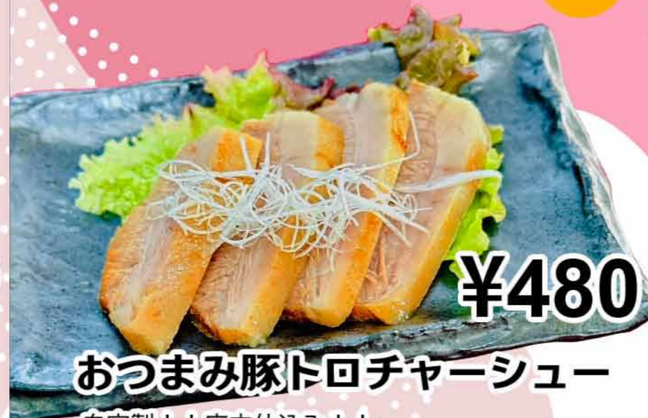
おつまみ豚トロチャーシュー

自家製!!店内仕込み!! 希少部位の豚トロはとろける柔らかさ♪ 厚切りで食べ応えのある旨さです!