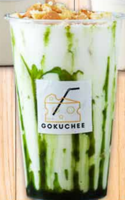
抹茶GOKUCHEE Matcha Gokuchee 700円