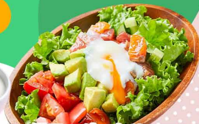
温玉マグロとサーモンの 海鮮サラダ (ごまドレッシング)