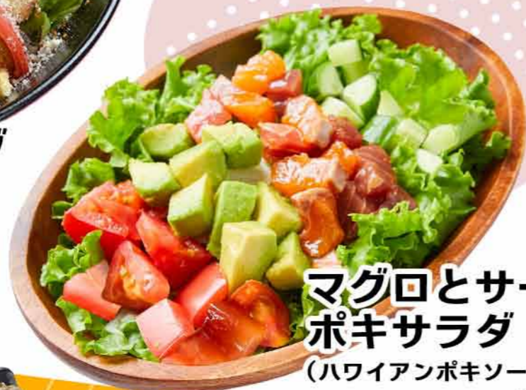
マグロとサーモンの ポキサラダ (ハワイアンポキソース)