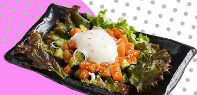
サーモンの韓国風ユッケ ¥750